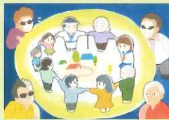
最優秀賞 佃 凜音さん(高2 香川県)