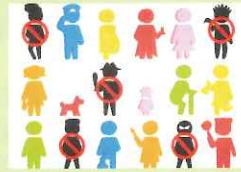
佳作 穴井 望恵花さん(高3 香川県)