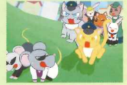
佳作 中村 りむさん(高3 鹿児島県)